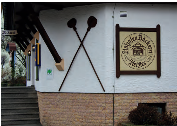
Schon an der Ladenfassade wird für Bio und Naturland geworben.