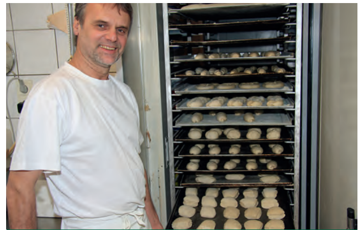
In langen Teigführungen werden das Weizenkleingebäck und die Semmeln geführt.

hannes Mehl die Verwendung eines Bio-Brötchenbackmittels von UlmerSpatz. „Es ist allerdings nicht Naturland zertifiziert und wir können die Semmel nicht mit Naturland ausloben.“ Aber auch seine Frau Luzia sieht dies als Chance an, trotzdem noch am Semmelmarkt bestehen zu können. Den Kunden sei eben Volumen, Ausbund und Rösche wichtig. Bei Feingebäck und Konditoreiprodukten wird in der Bäckerei Mehl nur das Bio-Mehl verwendet. „Alle Zutaten in Bioqualität einzukaufen ist momentan etwas kom-