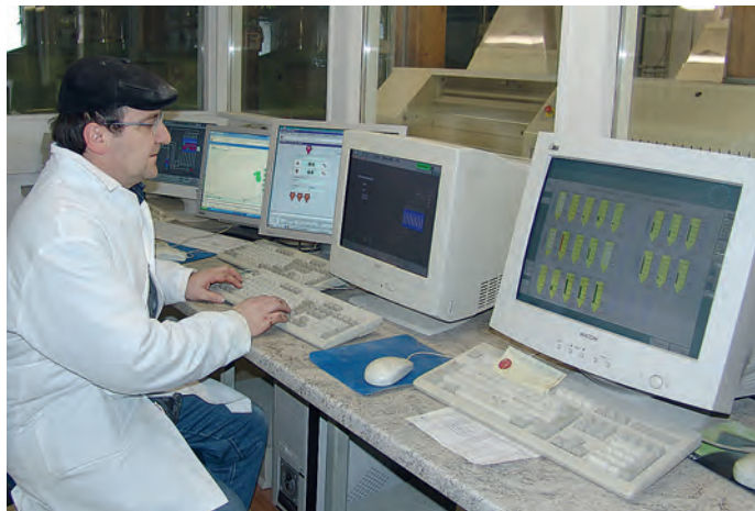
Bio heißt auch die modernste Technik nutzen, wie hier in der Technikzentrale der Meyermühle in Landshut.

gemeinsam mit den starken Zeichen der Öko-Verbände zu positionieren. Mit dem höheren Richtlinienniveau und der garantierten Herkunft der Rohstoffe, kann sich der Bäcker somit deutlich von den Bio-Produkten auf EU-Bio-Niveau des LEHs und der Discounter abheben. Untersuchungen zeigen, dass Kunden gerade im Biobereich Wert auf persönliche Beratung und Fachkompetenz legen. Hierin sehe ich einen klaren Wettbewerbs-