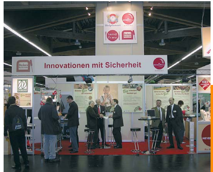
Am Stand der Meyermühle können sich interessierte Bäcker über den Einstieg in den Biobackwarenmarkt informieren.

Backwaren der Discounter meist nur dem Mindeststandard der EU-Bio-Verordnung entspricht und keine Herkunftsgarantie enthält, garan-